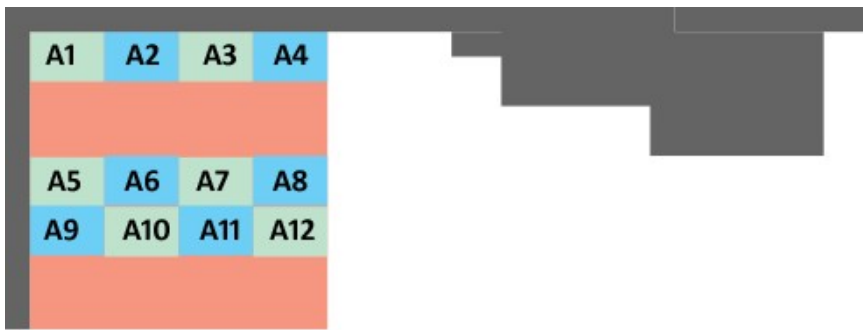
Corredor de saída do prédio